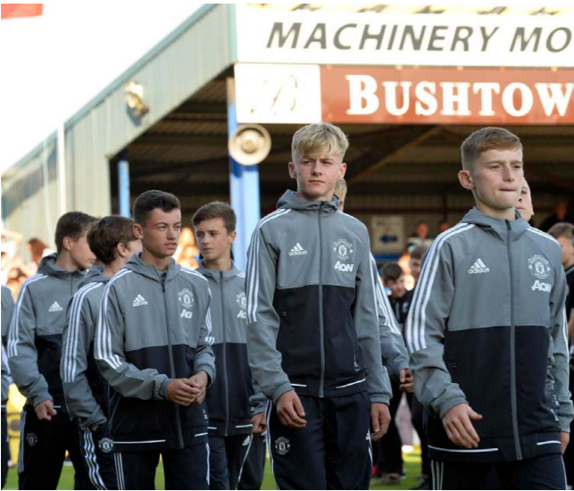
Milk Cup, Coleraine, Portstewart, Portrush

La copa milk de Irlanda del Norte es un torneo de fútbol juvenil internacional. Uno de los campeonatos de fútbol juvenil más prestigiosos de Europa, que presenta equipos de algunos de los mejores clubes del mundo como FC. Barcelona, Manchester United, Club America y Bayern Munich. Cuenta con David Beckham, Giovanni Dos Santos, Paul Scholes y Wayne Rooney como participantes en años anteriores. Las chicas tienen la oportunidad de desfilar con alguno de los equipos y saldrán en los periódicos!