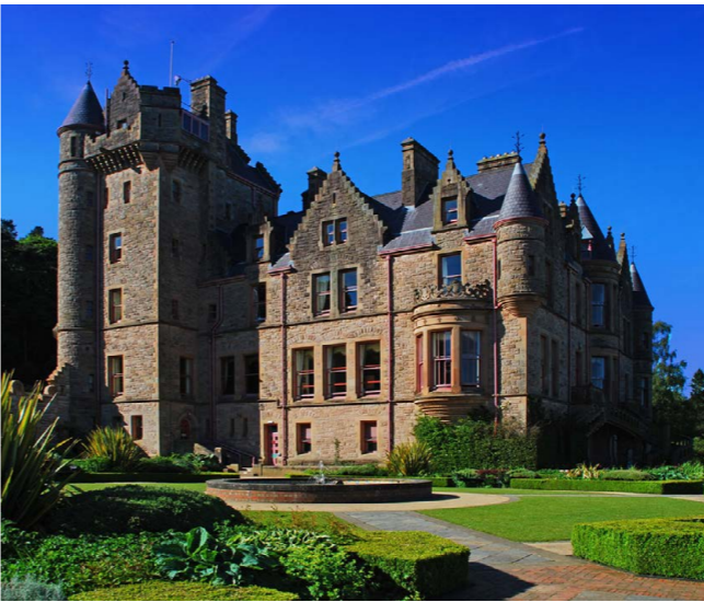
Castillo de Belfast

El Castillo de Belfast (Belfast Castle en inglés) es un castillo histórico, construido en el año 1870.