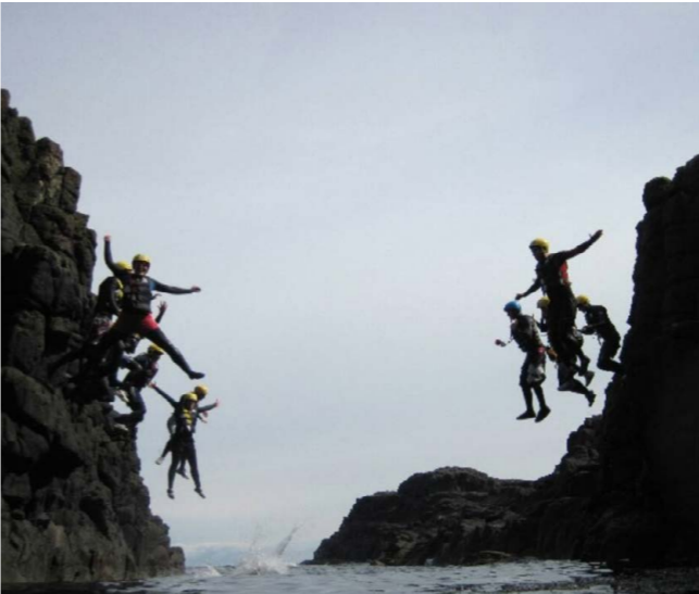
Water sports, Causeway Coast Coasteering

Coasteering: Desde el principio hasta el final es un día fantástico! Con los expertos de Causeway Coasteering Specialists, es un excelente día saltando desde acantilados junto al puerto de Ballintoy. La actividad es completamente agradable, incluso en las precarias condiciones climáticas. Comenzará con saltos pequeños desde rocas hacia el mar y luego las caídas son cada vez más altas. Los guías para el día están bien informados, pacientes y son profesionales. ¡Es algo que todo el mundo debe probar!