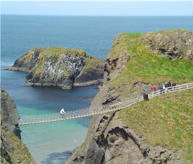
Castillo de Dunluce/ Puente Colgante, Bushmills

Este castillo medieval de finales del siglo XVII, dramáticamente colgado de unos rocosos acantilados y mirando hacia el Atlántico Norte, fue el cuartel general del clan de los MacDonnell. En él se lucharon constantes batallas y eventualmente, sucumbió al poder de la naturaleza cuando una parte del castillo cayó al mar en una noche tormenta en 1639. Poco después fue abandonado.